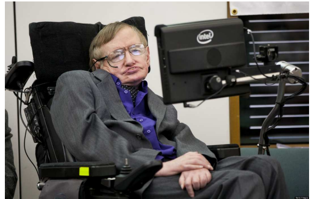
ब्रिटिश भौतिक शास्त्री एवं गणितज्ञ स्टीफन हॉकिंग

शायद ही कोई टैक्नोलॉजी दुष्प्रभाव से मुक्त हो। आज टैक्नोलॉजी को व्यवसाय बना दिया गया है। व्यवसायी प्रवृत्ति से बनी टैक्नोलॉजी अपना प्रचार इस ढंग से करती है कि भोगवादी मानव उसे अपनाने के लिए आतुर हो उठता है। इस मनुष्य को भोगवादी बनाने में तामसी दूषित भोजन, श्रंगारी-साहित्य-दर्शन व श्रवण की बहुत बड़ी भूमिका है। मांस-मदिरा व अन्य मादक पदार्थ इसमें और भी वृद्धि करते हैं। उधर हथियारों की विनाशक दौड़, तामसी, मूर्ख व सनकी लोगों के हाथ में परमाणु हथियार क्या इस सदी को भी पूरी होने देंगे? विज्ञान, टैक्नोलॉजी वा संसाधनों पर अयोग्य, अधार्मिक, तामसी, अज्ञानी व दुष्ट लोगों का अधिकार नहीं होना चाहिए और न ही टैक्नोलॉजी के दुरुपयोग का किसी को भी अधिकार होना चाहिए। सबको स्वतंत्रता व समानता के अधिकार के स्थान पर धर्मानुसार यथायोग्य व्यवहार की महर्षि दयानन्द की दृष्टि के बिना यह विश्व सुखी नहीं रह सकेगा। वैज्ञानिक जिस टैक्नोलॉजी को आज निरापद मानते हैं, कालान्तर में उसके दुष्प्रभाव प्रकाश में आ जाते हैं। आज मनुष्य पहले तो अपनी विलासिता के लिए टैक्नोलॉजी पर धन व श्रम का अपव्यय करता है फिर उसके दुष्प्रभाव खोजने में धन व श्रम का पुनः अपव्यय करता हुआ अपने विनाश का निरन्तर जाल बुनता चला जा रहा है। सुविधाओं की मरीचिका में फंसा कथित विकासवादी नाना दुविधाओं का संग्रह कर